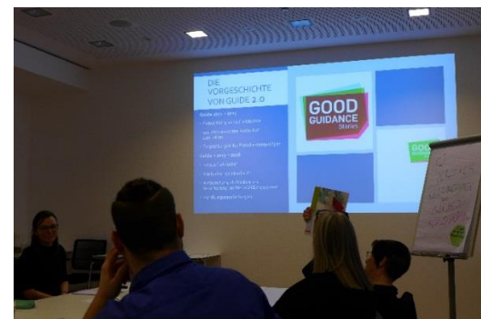
Focus group avec des professionnels à Berlin

Le Centre pour l'emploi de Ballymun, en collaboration avec Rinova, a conçu et développé une plate-forme d'apprentissage en ligne "Moodle" dans le but de tester les six études de cas, notes pédagogiques, guides méthodologiques et manuels de recommandations existants sur d'autres professionnels de la jeunesse. Un autre objectif d'apprentissage du programme d'études est l'introduction de la rédaction d'études de cas ainsi que le concept d'une communauté de pratique. La plate-forme Moodle, qui s'appuie sur les résultats du concept méthodologique Guide 2.0 , a été lancée début juillet et testée par les 6 partenaires européens. L'objectif était d'avoir un minimum de 10 participants/apprenants de chaque pays pour tester l'outil.