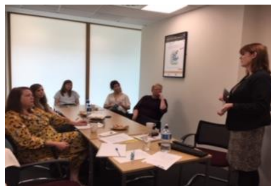
Présentation de la plateforme d'apprentissage en ligne à Dublin

“Un autre objectif d'apprentissage du programme d'études est l'introduction de la rédaction d'études de cas ainsi que le concept d'une communauté de pratique.”